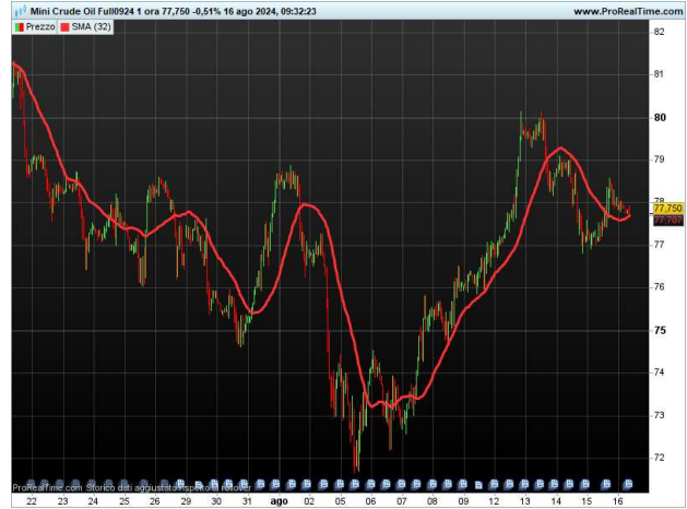
PETROLIO FUTURE 60 MINUTI