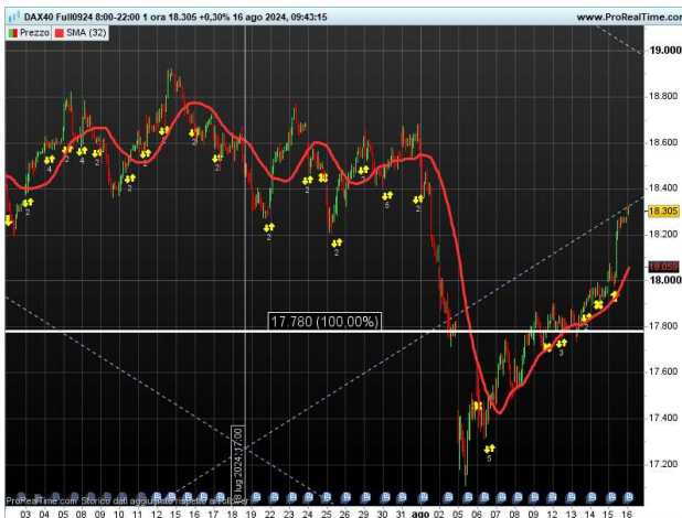
DAX FUTURE 60 MINUTI