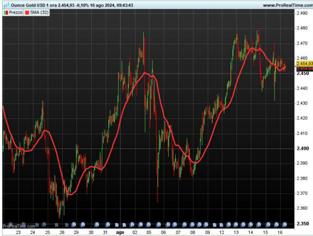
ORO SPOT 60 MINUTI